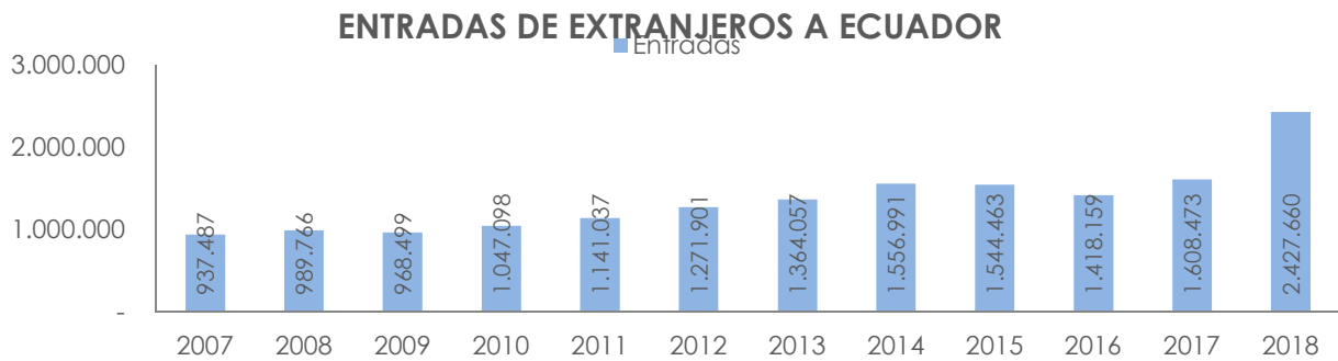
Grafico 1. Entradas de Extranjeros a Ecuador periodo (2007-2017).

Fuente: Registro Estadístico de Entradas y Salidas Internacionales, varios años